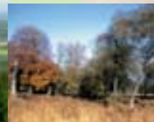
Palmbuch im Hunsrück