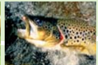
Frische Forellen – ein Hochgenuss