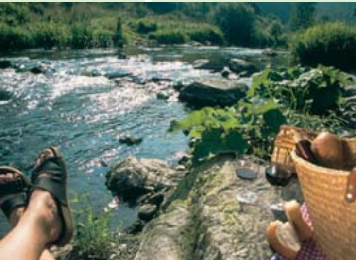
Picknick an der Nahe

Neben einer 2000-jährigen Weinkultur an Mosel, Saar, Ruwer und Nahe bietet der Naturpark eine Vielzahl regionaltypischer Getränke wie den Viez (Apfelwein), verschiedene Edelobstbrände, mineralisches Wasser aus den Tiefen des Hochwaldes und hausgebrautes Bier.